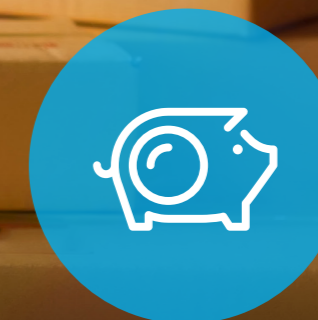
Einsparungen bei Frankierung und Versand