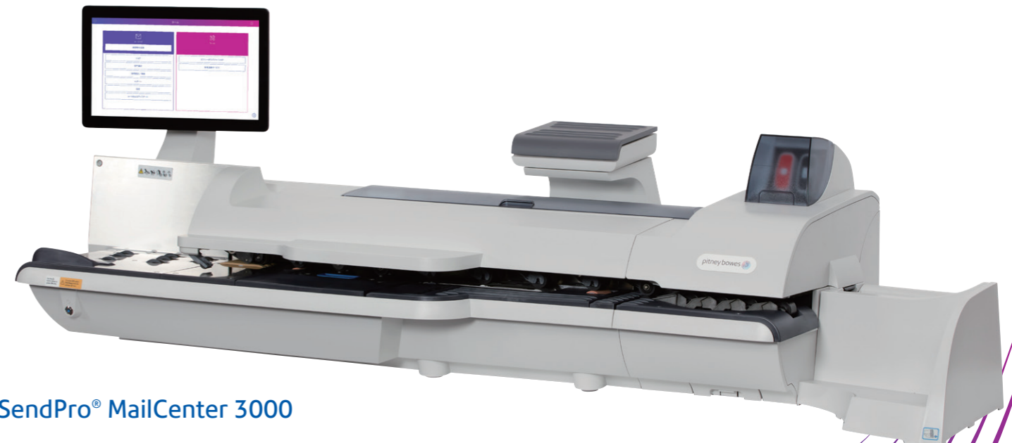
SendPro® MailCenter 3000