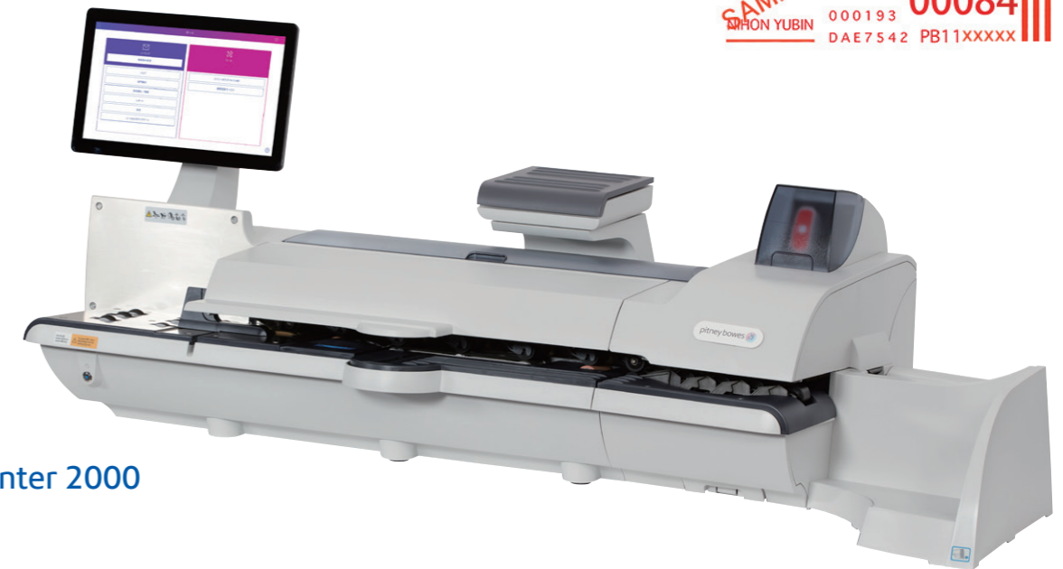
SendPro® MailCenter 2000