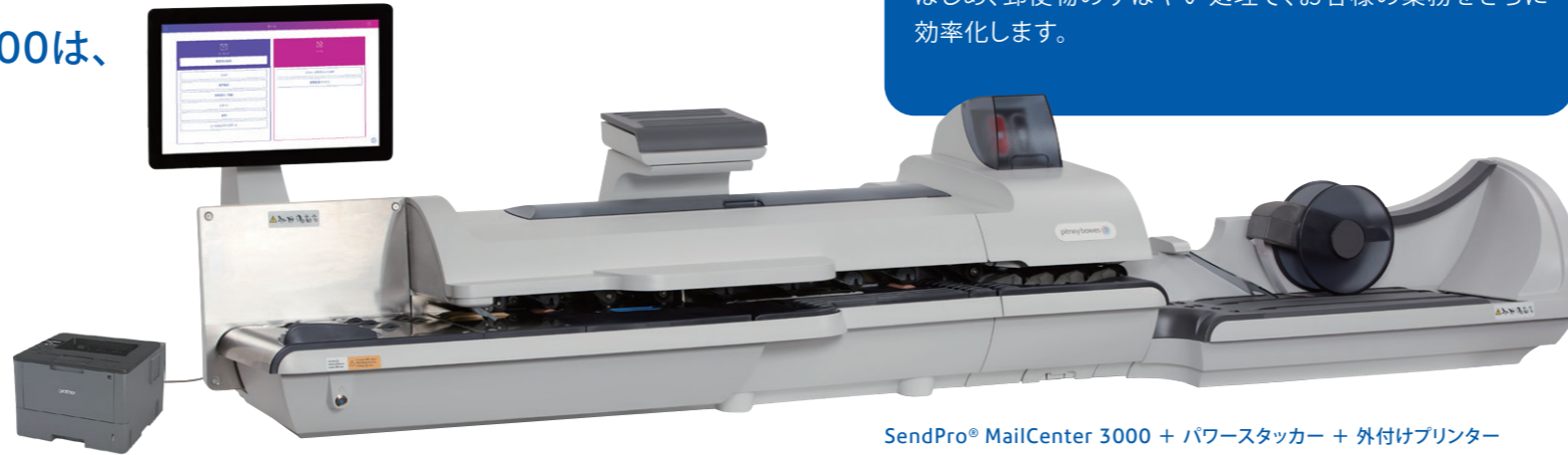
SendPro® MailCenter 3000 + パワースタッカー + 外付けプリンター

SendPro® MailCenter 2000 / 3000は、 重さやサイズの違う大量の 郵便物の処理が可能です。 またお客様のニーズに応える様々な オプションを用意しております。